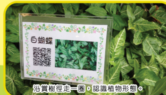
沿賞樹徑走一圈，認識植物形態。