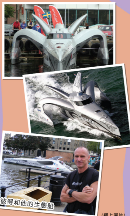
彼得和他的生態船

很多都市人都有過胖問題，千方百計把身上「肥膏」消滅，但請不要浪費，原來脂肪可以當作燃料呢！