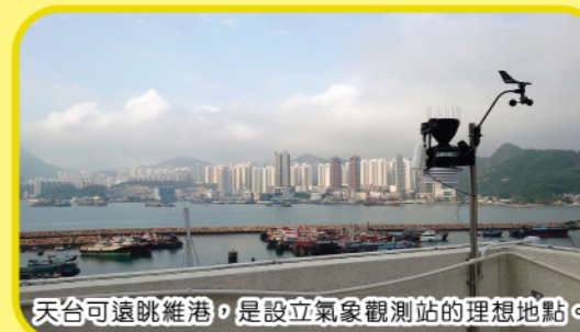
天台可遠眺維港，是設立氣象觀測站的理想地點。