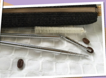
鈦金屬筷子頭連接位有矽膠環，裝拆方便。