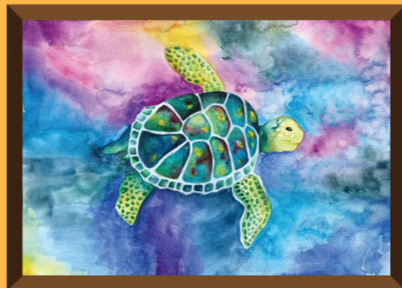
The Turtle Who wanders By Yulia