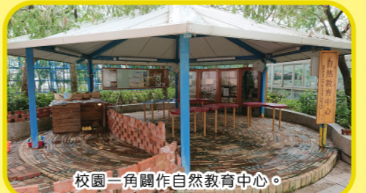
校園一角闢作自然教育中心。