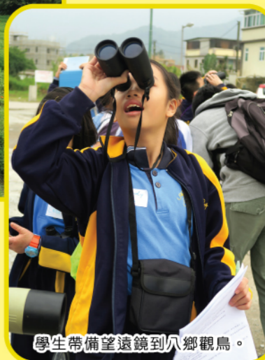
學生帶備望遠鏡到八鄉觀鳥。