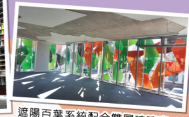
遮陽百葉系統配合雙層玻璃窗，可調節樓內溫度節省能源。