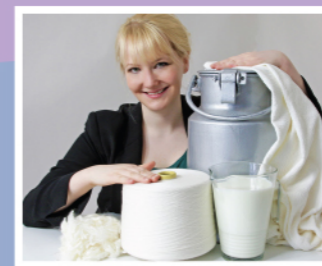
多馬斯克把廢奶神奇地變成衣服！