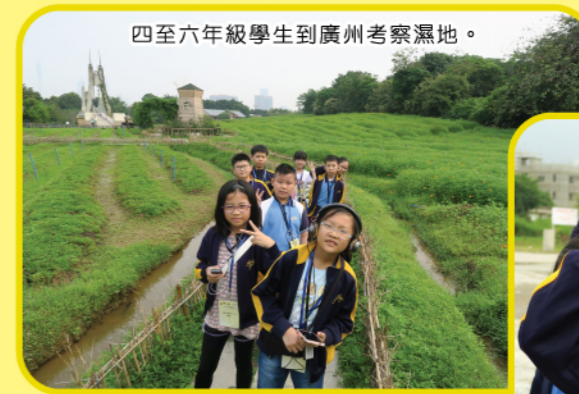
四至六年級學生到廣州考察濕地。