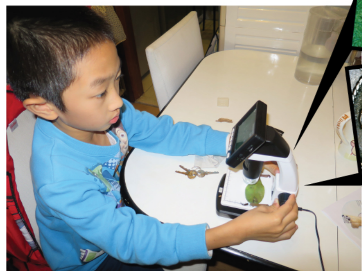
不一樣的相機——顯微鏡 拍攝資料：UM038B f/2.8 1/8sec 8mm