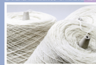
這些線看不出是由牛奶造成吧！