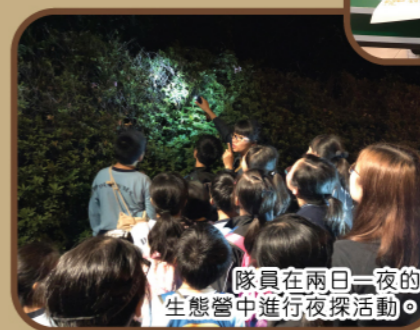
隊員在兩日一夜的生態營中進行夜探活動。