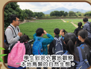
學生到郊外實地觀察本地鳥類的自然生態。