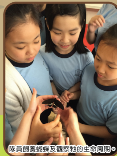
隊員飼養蝴蝶及觀察牠的生命周期。