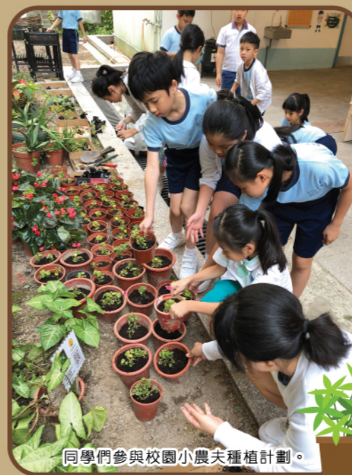
同學們參與校園小農夫種植計劃。