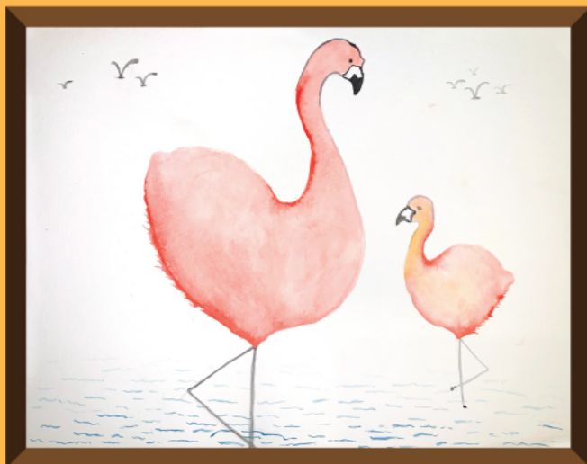
Flamingos By Yulia

The graceful flamingos dance across the crystalline streams, Twirling, leaping, gliding in tatus of pinks and creams. Even the little shrimp dance along their pointed shoes, The water hams along as it rushes by too! As the weeds jiggle, the birds wiggle, Prancing to the music with their ancanny crew. Performing the concert of a lifetime, In a garden of pink flowering hues.