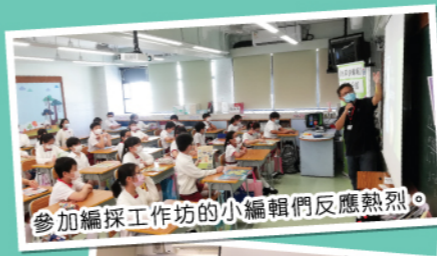
參加編採工作坊的小編輯們反應熱烈。

《地球快樂報》是提倡環保和快樂正向的刊物，也是屬於香港小朋友的報紙。雖然受疫情影響，我們的「聯綠會」分社活動依然未有停下來，只是換成網上形式更安全地進行。活動完成後，不少小編都按指引遞交了稿件，今期就精選他們的作品「新地球 VERSION 2.0」給大家欣賞吧！