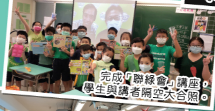
完成「聯綠會」講座，學生與講者隔空大合照。