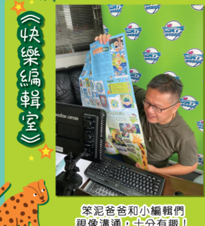
笨泥爸爸和小編輯們視像溝通，十分有趣！

而在新地球的鄉郊和農村地區則被茂盛的植被所覆蓋，就連沙漠也變成了森林，畢竟新地球人並不希望植物和動物滅絕，所以他們都盡可能在這裏保護生態，這樣便能與大自然和平共處。另外，燃油汽車已經在新地球裏消失了，取而代之的是電動交通工具，減少空氣污染。