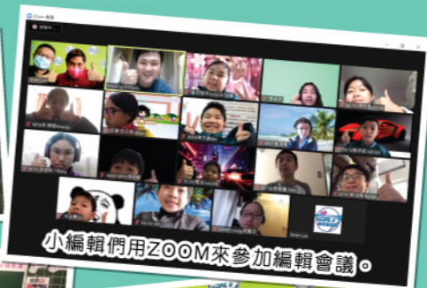
小編輯們用 ZOOM 來參加編輯會議。