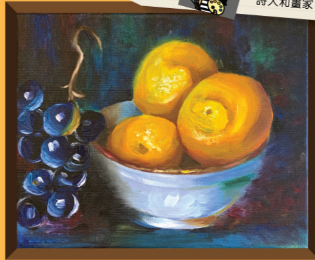
Harvest Time By Yulia

The times come for harvest, The times come to reap, The grapes and the lemons, To pick and to eat. The farmers they work hard, To plant and to earn. They farm past the heavy storms, And feel the summer's barn. The crops and the fruit, Now juicy and ripe, Getting sold in the market, For money and hype. The farmer's devotion, Once again spent on growing plants anew, Returning a new cycle of seeds, To help a family get through.