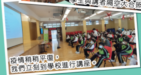
疫情稍稍平復，我們立刻到學校進行講座。